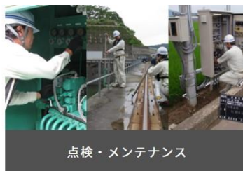
点検・メンテナンス