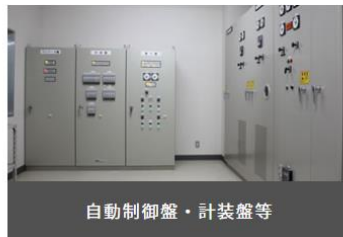
自動制御盤・計装盤等